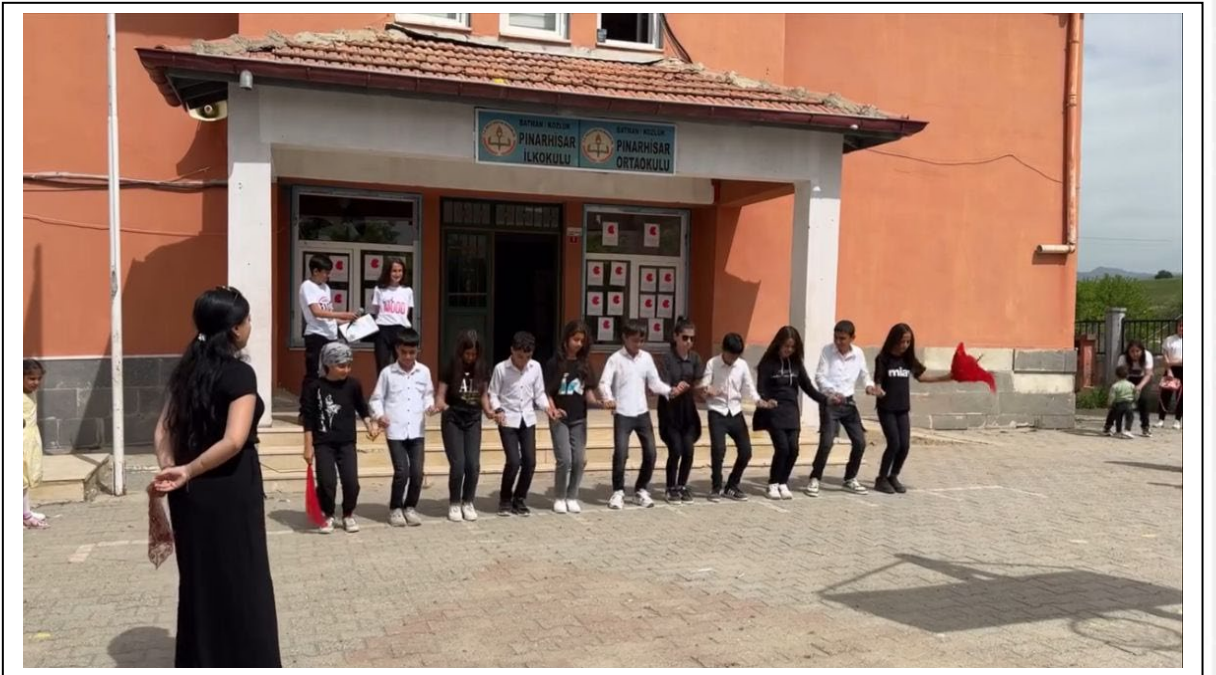
23 Nisan Ulusal Egemenlik Bayramı