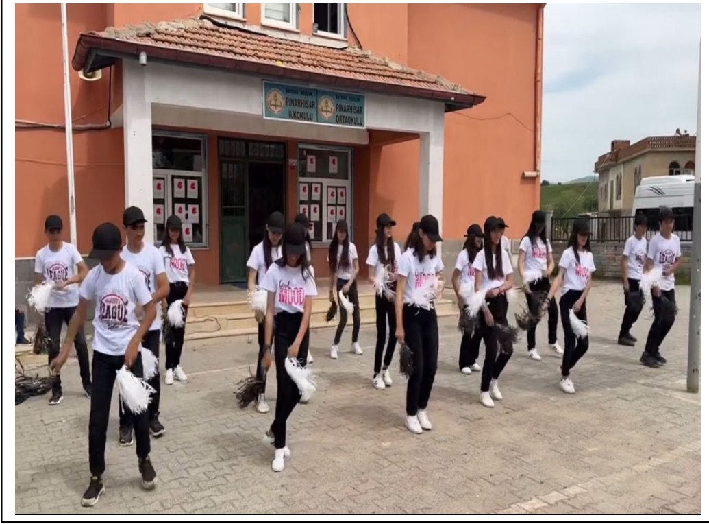
23 Nisan Ulusal Egemenlik Bayramı