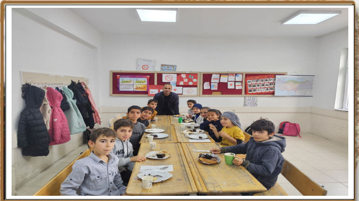
Yerli Malı Haftamız