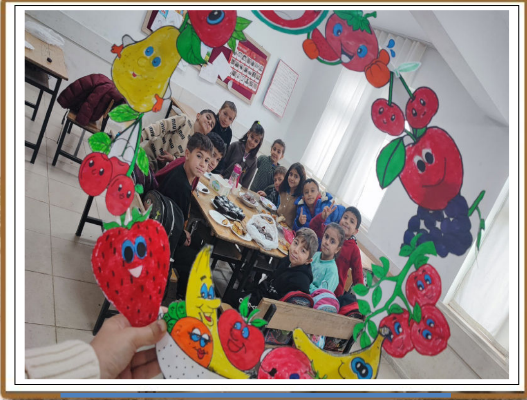
Yerli Malı Haftamız